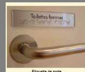
Etiquette de porte