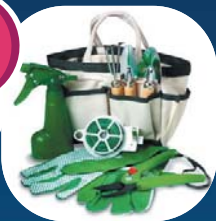
1 kit de jardinage