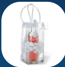
1 Ice bag®